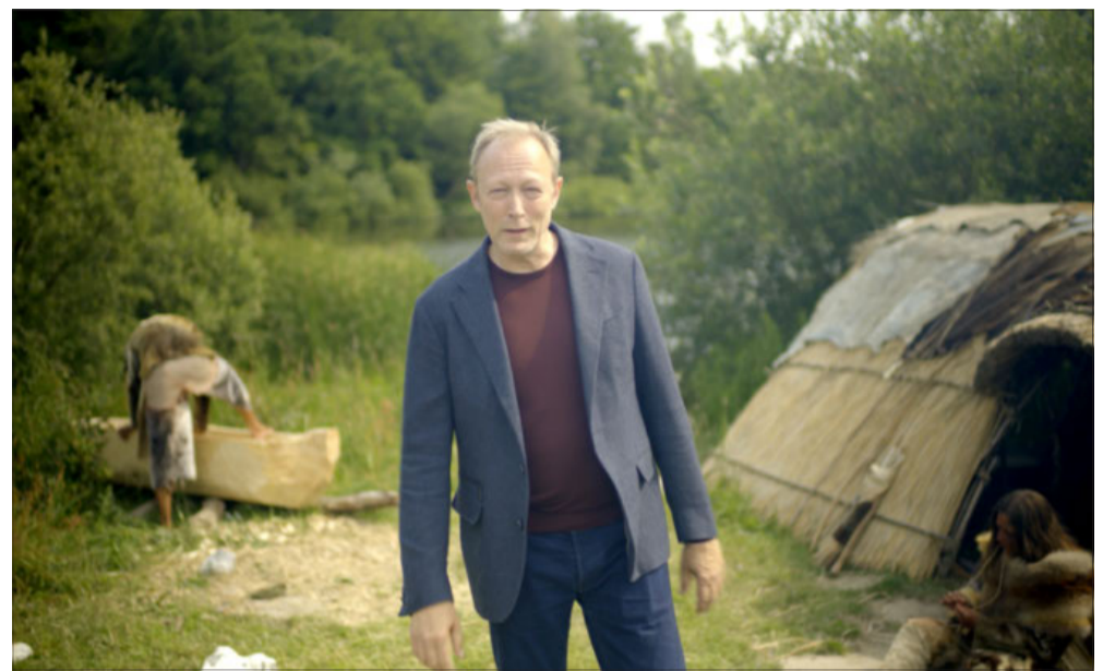
Lars Mikkelsen taler godt og tydeligt – nu skal man så bare vænne sig til den pingvinagtige måde, han dasker med hænderne på, når han lunter omkring i de danske landskaber.

Men sådan er det jo, man må sætte foden ned, og det vil man altid gøre ud fra sin egen tids forestillinger. Pudsigt i den forbindelse er behandlingen af det køns-historiske i jæger-samler-