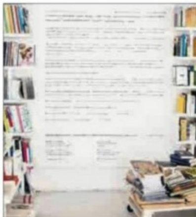
LITTERATURHUS: House of Foundation huser Audiatur bokhandel, visningsrom, kontorer m.m.

Debutanten skriver kjempende setninger som strømmer over i hverandre.