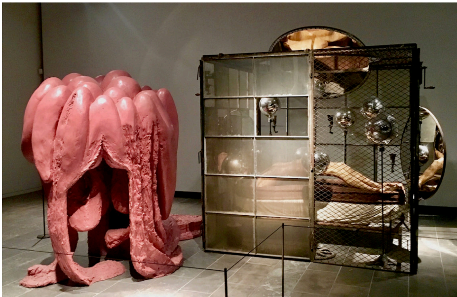
Louise Bourgeois, In and Out, 1995.

Allerede på vejen ind i vandbussen mod Venedig indløb meldingerne. Min rejsepartner, som var taget i forvejen, opholdt sig nu på tredje time i Den Tyske Pavillon, som også for mig blev en af årets stærkeste kunstopplevelser. Fascisme og fashion er et lige så forbudt og umuligt skæringspunkt i Den Tyske Pavillon, som Beethovens Symfoni nr. 9 og ultravold er det i Stanley Kubricks Clockwork Orange . Men Anne Imhof gjorde det med angstprovokerende præcision og en udefinérbar stemning af stilsikker vold, der sivede gennem den tomme pavillon med indsat glasgulv. Performerne – en slags Wolfgang Tillmans 90er- kids , bare uden følsomheden – masede sig vej gennem publikum med hoven mine eller poserede selvhøjtideligt i jeans og bar mave fra et lille podie højt oppe over vores hoveder. De manglede bare schäferhundene for at fuldende looket. De stod til gengæld udenfor bag gitterbure og gøede af den lange kø af publikum. Radikalt og med så meget ætsende zeitgeist , at det med garanti ikke holder til næste sommer. Bravo!