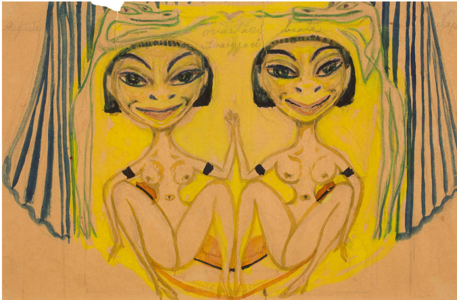
Ovartaci & Galskabens Kunst , Kunsthal Charlottenborg, København. Kurateret af Mathias Kryger.

Før Charlottenborg diskede op med Mathias Krygers ambitiøse, museumsverdige udstilling, havde jeg aldrig set et eneste af Ovartacis fantasy-værker IRL. Historierne var selvfølgelig løbet i forvejen; om den skizofreni-diagnosticerede Ovartaci, som boede på psykiatrisk hospital i 56 år, som var noget af en begavelse – kunne flydende kinesisk – og som levede tæt med sine værker, gik tur med sine papmaché-dukke og kysede dem godnat hver aften. En kunstner, der kom forbi mit kontor, fortalte mig en utrolig historie om, hvordan man for nogle år siden havde hørt noget, der raslede inde i en af dukkernes hoved. Da man forsigtig åbnede op, lå der en pyttelille bog skrevet med mikrogram-håndskrift – altså dukkens indre, dens tanker! Og sådan bliver det tilsyneladende ved med denne kunstner og jeg vil vide det hele. Hvem vil sætte sig ned sammen med mig og fortælle mig alle disse historier?