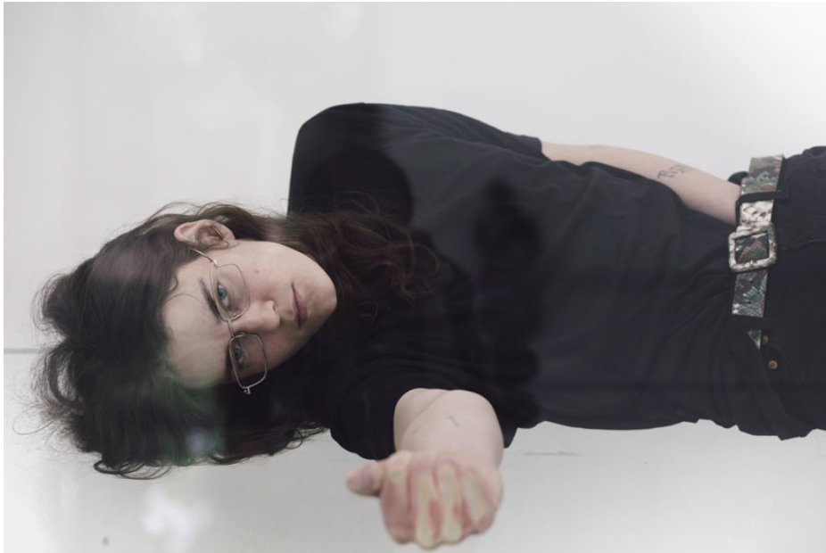
Anne Imhof, Faust, 2017, Den Tyske Pavillon, 57. Venedigbiennale.