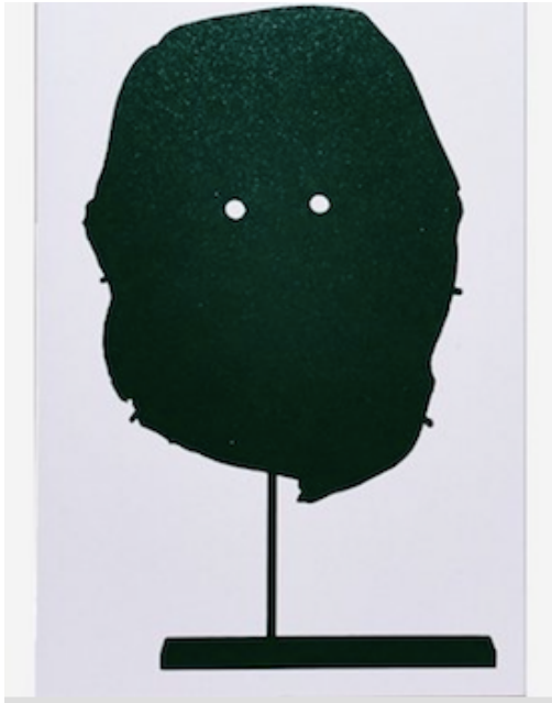
FOS, Gestalt , InOtherWords, London,

Når man arbejder i så internationalt et felt som billedkunst, hvor alle har styr på hvilken udstilling, der just er åbnet i Paris eller hvilke kontroverser, der huserer omkring et offentligt monument i en vilkårlig amerikansk by, kan man ind i mellem tvivle på ideen om et magasin på skandinaviske sprog såsom Kunstkritikk. Hvorfor ikke bare kommunikere på engelsk med hele verden, døgnet rundt. Men sådan fungerer det jo ikke. Sprog er virkeligheder, farver og nuancer og serien Bestiarium, dedikeret til litterære kortformer, er et godt eksempel på det meningsfulde i ikke kun at udgive, men også at oversætte, skitser, poetikker og korte tekster af enhver slags. Le Guins Bæreposeteorien om fiktion lå på bordet hos to forskellige studerende, som jeg havde ateliersamtaler med på Kunstakademiet i København. Den første gennemgik teksten ret minutiøst og vakte min nysgerrighed. Den anden forærede mig simpelt hen bogen. Dagen efter satte jeg mig i Christianshavns Bådudlejnings vinterhytte ved kanalen, beholdt vinterfrakken på og kiggede ud på det kolde vand, mens jeg lod mig opsluge af tanken om romanens rette form – en sæk, en pose, en medicinbylt eller en «livmoder for det vordende». Alt imens den tykmavede kakkelovn ved siden af slutte brænde og brummede med.