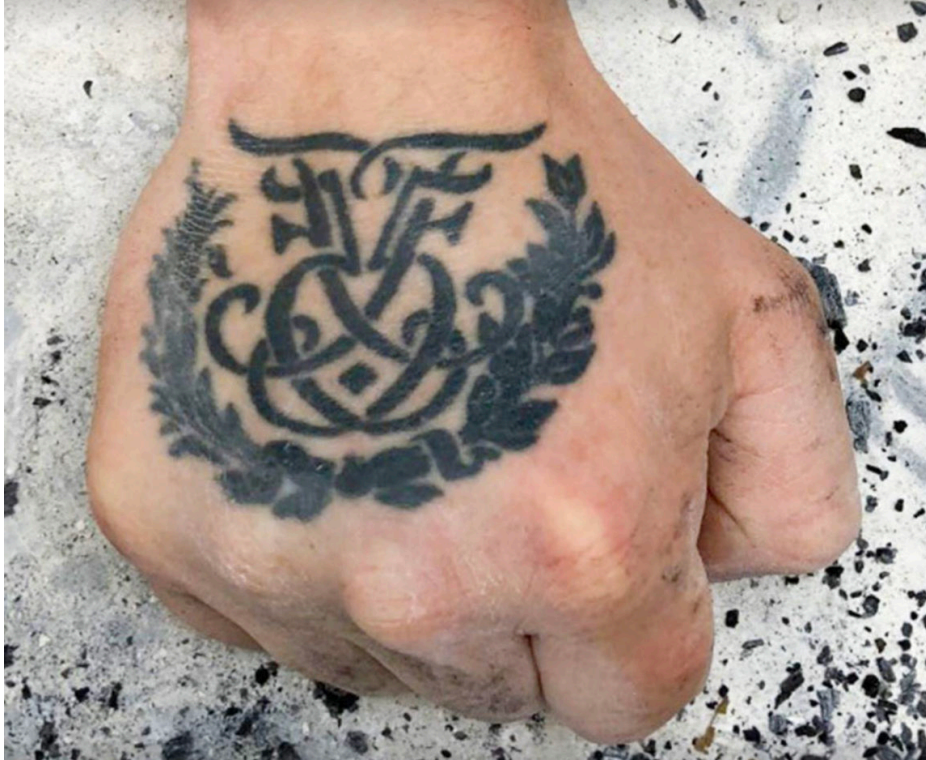
Profilbillede, Facebookgruppen «Studerende på Kunstakademiets Billedkunstskoler»

De studerende på Det Kgl. Danske Kunstakademi slog tilbage.